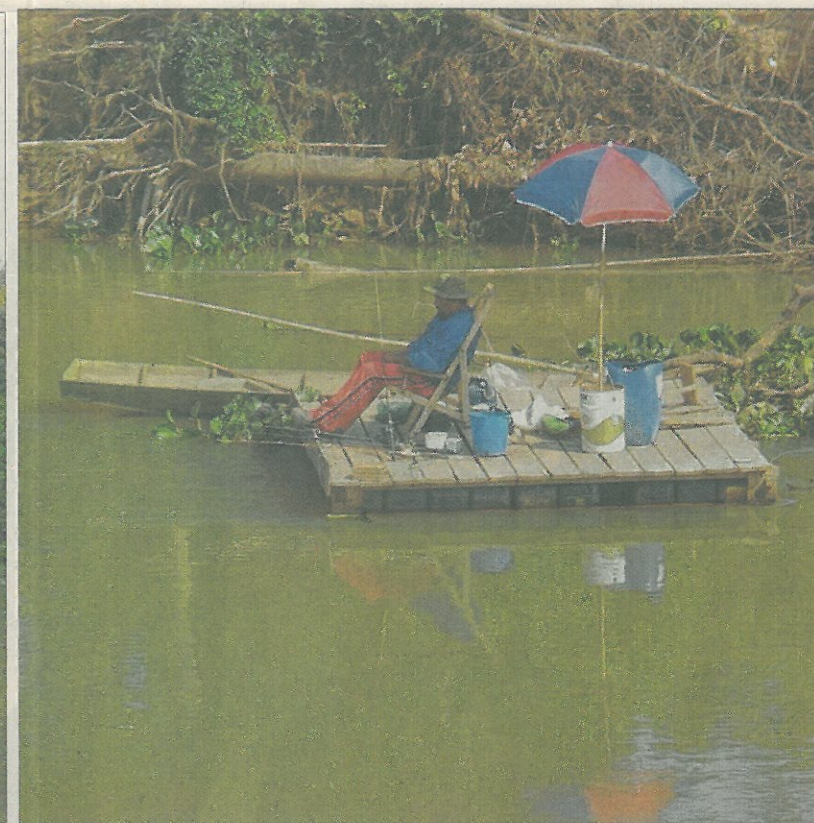
Das Pantanal ist das größte Süßwasser-Sumpfbgebiet. Die Metzinger Gruppe bestaunte dort die Vielfalt von Pflanzen und Tieren.